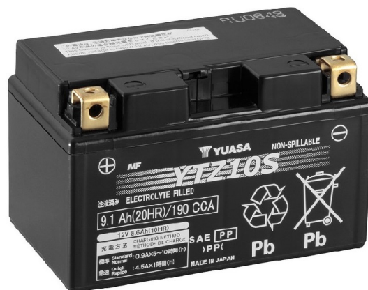
For Illustration Purposes Only